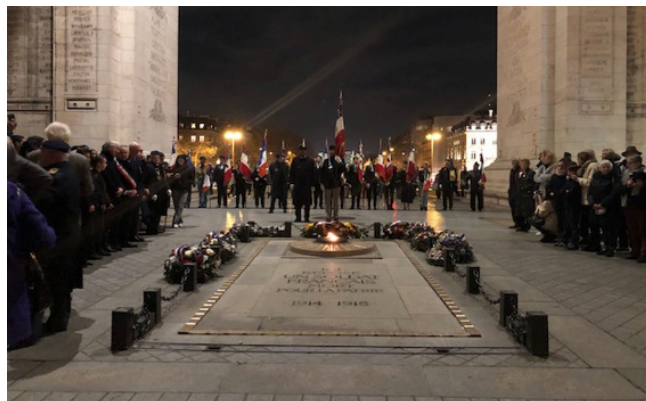
La tombe du soldat inconnu.