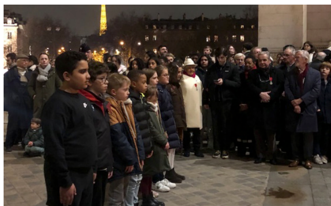
Des jeunes scolaires au garde-à-vous devant la tombe du soldat inconnu.