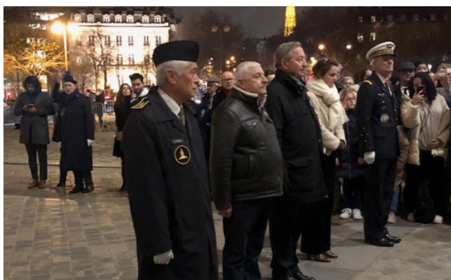
L'amiral Coldefy, président de la SMLH (au centre), et les autorités.