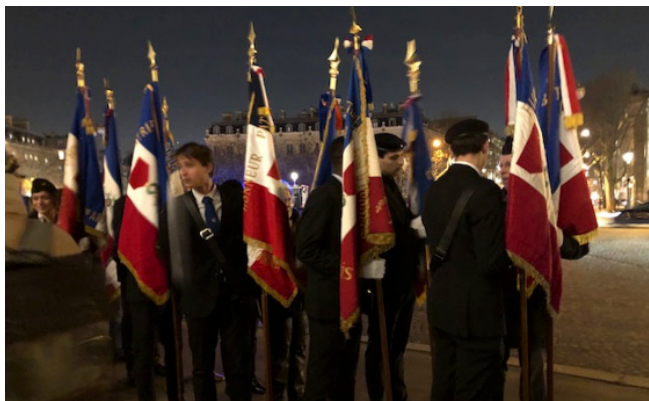
Les jeunes porte-drapeaux, avant la cérémonie.